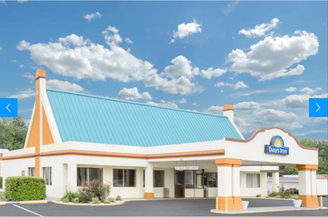
King Charls Inn Charlston